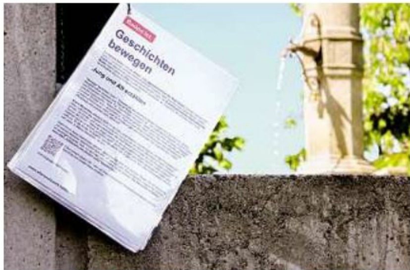
Geschichten bewegen – zum Beispiel auf dem Stadthauskänzeli

Wer weiss noch, dass es erst sieben Jahre her ist, als den Wirtshäusern das Eis zum Kühlen der Biere noch per Fuhrwerk geliefert wurde? Ein heute über 75-jähriger Badener erinnert sich gut an die meterlangen Eisblöcke, die der Fuhrmann vor dem «Rebstock» und dem «Grossen Alexander» zerkleinerte. «Dann sprangen meist mehr oder weniger grosse Splitterstücke weg, die wir schnell vom Boden aufsammelten und daran zu schlecken begannen. Das war eine begehrte Köstlichkeit.» Die Jugendlichen von heute staunen bereits über weniger lang zurückliegende Begebenheiten: «Zur Jugendzeit meines Vaters kannte man noch die Telefonnummer der Freunde auswendig», hält eine 13-Jährige fest. Eine Schülerin schreibt über ihre Grossmutter: «Sie arbeitete bei 111. Eine Telefonnummer, auf die man damals anrufen konnte, um Fragen zu stellen und Auskunft zu bekommen - ziemlich praktisch zu einer Zeit vor Internet und Google.»