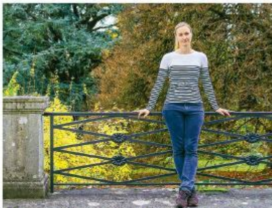
Seit Anfang Jahr ist die Koordinationsstelle Altersnetzwerk Baden der «Kompetenzbereich Alter» der Abteilung Gesellschaft der Stadt Baden, die neu acht Kompetenzbereiche umfasst