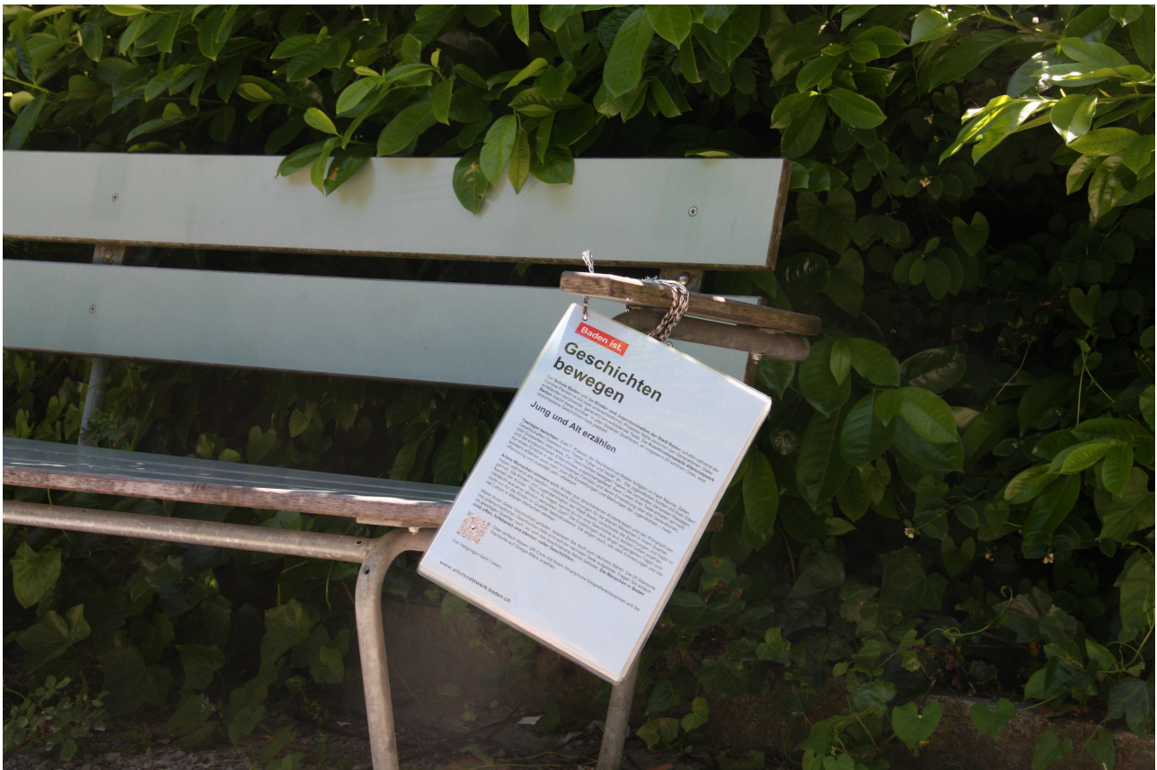
Eine Bank mit Geschichten: Davon gibt es in Baden jetzt ganz viele.